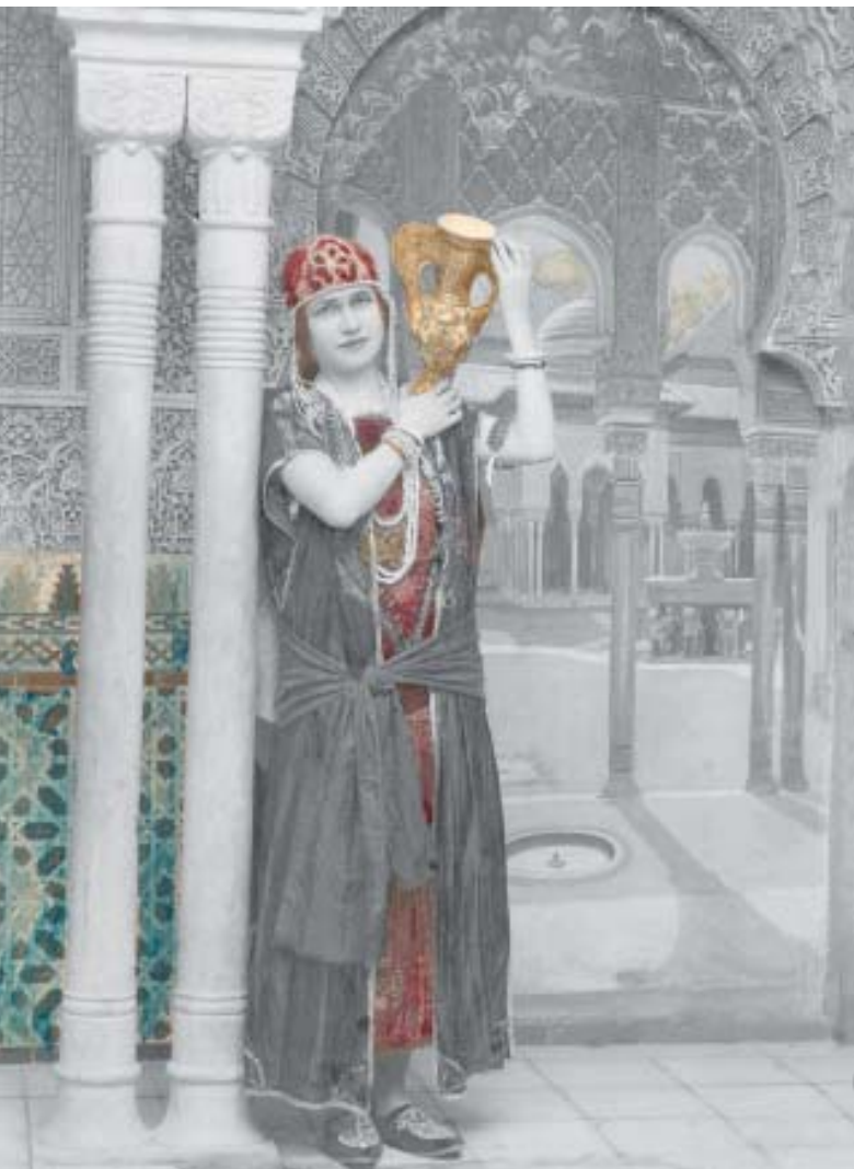
A. Mejía. Granada. Septiembre, 1929.

Hodelpa is a chain of three hotels in the old city (the Commercial, Caribbean Colonial and the Nicolás de Ovando). The Hodelpa Nicolás de Ovando consists of two levels; it is built in stonework made from the white quarry stone native to the island, on a gigantic boulder near the edge of the mighty Ozama River. From its balconies built with brick arches, its main garden and the pool area you can admire and enjoy a beautiful view toward the riverbanks, and its mouth stretching out as an arm into the Caribbean Sea. On the nearby avenue the Tourist Port of Sans Souci can be found, where cruise ships arrive from different parts of Europe and the Americas, and in particular there is a direct connection with the Island of Enchantment, Puerto Rico, a trip that can be completed in one night by Ferry.