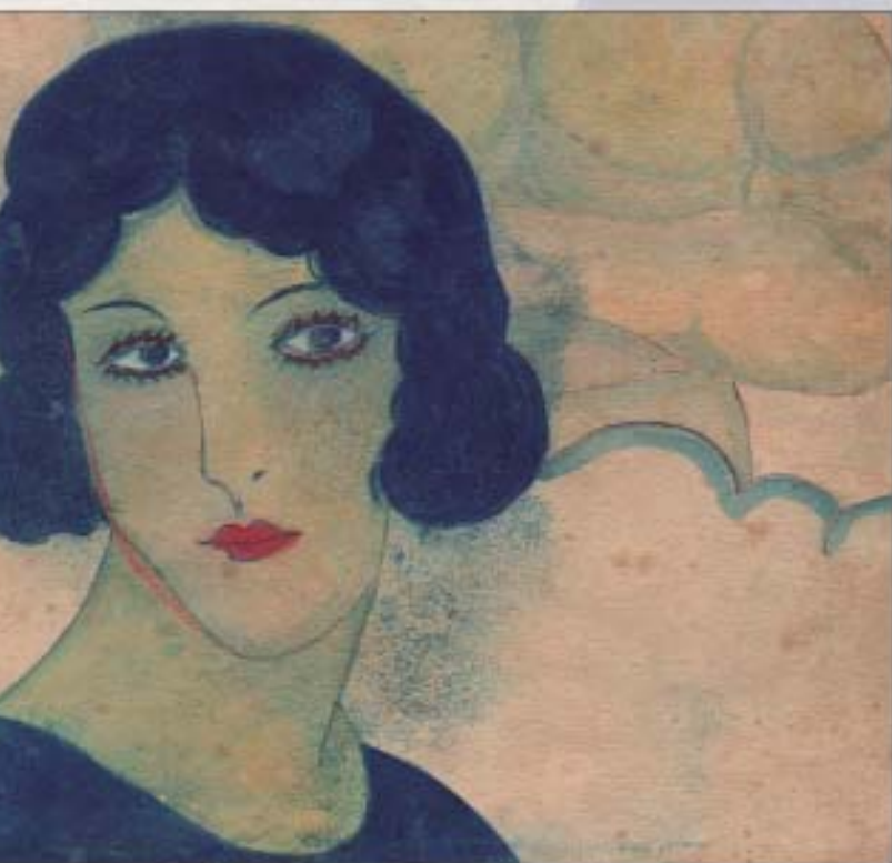
«Mujer» boceto para la ilustración de la portada de su novela Suena Pilarín... de © Abigail Mejía (Barcelona; Albés, Impresor, 1925).

Redes trasatlánticas. Re-presentar y re-conocer: Cinco siglos de iniciativas y aportes por parte de las mujeres hispánicas